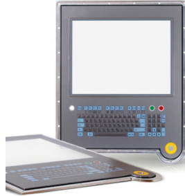
Impresión clara y duradera de signos e inscripciones con SEFAR PME (© Danielson Europe BV)