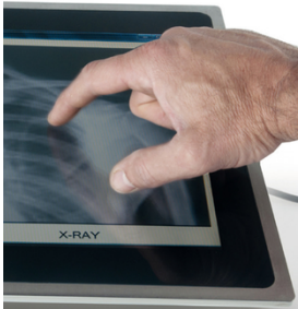
Se trate de enmascaramientos de bordes o revestimientos protectores impresos