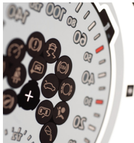
La vía rápida con la máxima eficiencia y calidad de impresión con SEFAR PME