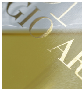
Letras de alta densidad con bordes muy definidos en frascos de perfume con SEFAR PCF