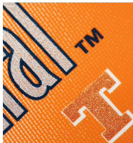
Impresión de textos con bordes muy definidos y gran legibilidad en etiquetas con SEFAR PCF FC