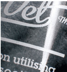
Excepcional calidad de impresión de semitonos pequeños en tubos de plástico impreso