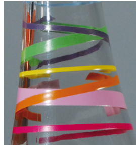
Alta densidad y contornos muy definidos con SEFAR PA