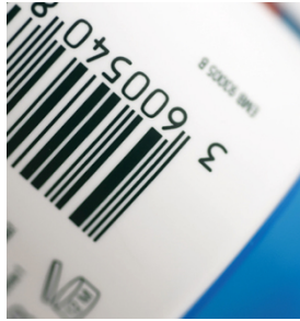
Impresión de códigos de barras de alta densidad y con bordes muy definidos con SEFAR PA