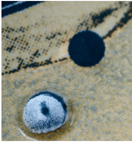
Baldosas estructuradas y muy resistentes con SEFAR PA

SEFAR PA está indicada para aplicaciones que deben usar colores muy abrasivos o cuando la plantilla ha de ajustarse a los sustratos moldeados, como en la impresión en azulejos, plástico o vidrio.