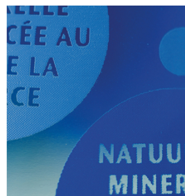
Colores brillantes y bordes de impresión nítidos con tintas UV. Impreso con SEFAR PCF 120/305-34Y