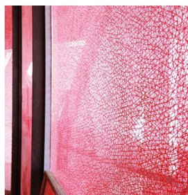
Para imprimir imágenes precisas y duraderas en fachadas de cristal con SEFAR GLASSLINE 68/175-95W