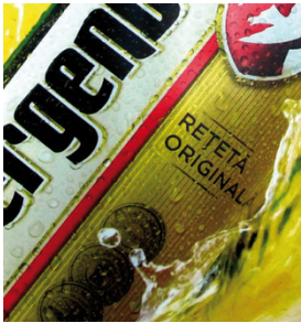
Impresión de carteles retroiluminados con semitonos de más de 30 líneas/cm con SEFAR PET 1500

El rendimiento de SEFAR PET 1500 es impresionante en una amplia variedad de aplicaciones, que van desde la serigrafía gráfica de tamaños grandes o pequeños (como carteles, visores y señalizaciones), impresiones sobre plásticos (como en artículos deportivos, piezas termoformadas, etc.) a la decoración de cerámicas, directa o indirecta, así como en impresiones de tejidos y otras tareas de impresión industrial.