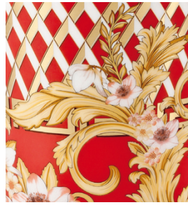
Excelente reproducción de detalles en las calcomanías de cerámica impresas