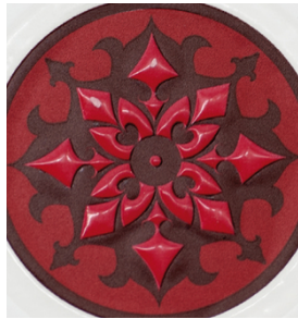
Para lograr exclusivos barnices transparentes en etiquetas impresas con SEFAR PET 1500