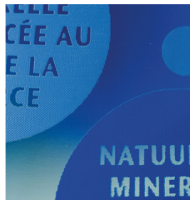
Colores brillantes y bordes de impresión nítidos con tintas UV. Impreso con SEFAR PCF 120/305-34Y