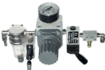
El control de mando básico junto con SEFAR 3A