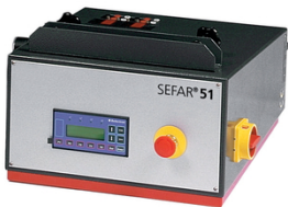
El control de mando electrónico de circuito sencillo o doble programable junto con SEFAR 3A

Existen dos opciones para distribuir el suministro del aire en los sistemas de circuito sencillo o doble: los sistemas de circuito sencillo o doble disponen de opciones complementarias para alcanzar una tensión equilibrada óptima en cualquier tamaño de tejido o marco. Se recomienda usar sistemas de circuito sencillo en marcos con longitud no superior a 150 cm. Mientras que para los marcos de tamaño superior a 150 cm se aconseja usar sistemas de circuito doble.