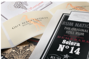
© Marbau GmbH & Co. KG