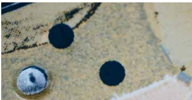
Baldosas estructuradas y muy resistentes con SEFAR® PA 61/155-60W

SEFAR® PA está indicada para aplicaciones que deben usar colores muy abrasivos o cuando la plantilla ha de ajustarse a los sustratos moldeados, como en la impresión en azulejos, plástico o vidrio.