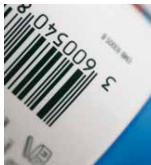
Impresión de códigos de barras de alta densidad y con bordes muy definidos con SEFAR® PA 140/355-30Y