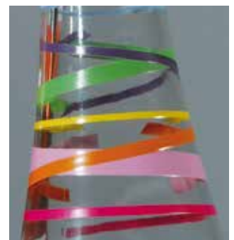
De alta densidad y contornos afilados con SEFAR® PA 100/255-38Y