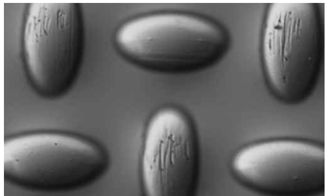
El tejido de poliéster estándar 120/305-34W tras 5000 impresiones